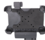
Base para vehículo